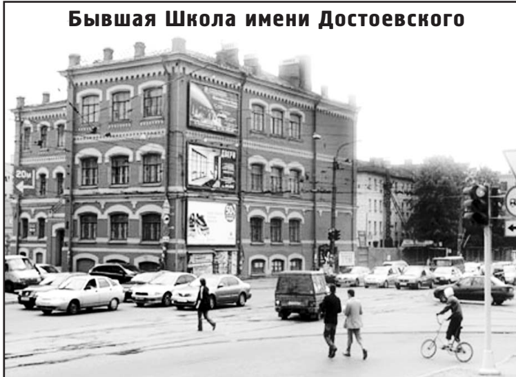
Бывшая Школа имени Достоевского

Коренная реорганизация ожидает дополнительное образование. Детско-юношескую спортивную школу во Всеволожске хотят объединить с Морозовской, Кузьмолловскую с Сертоловской. Всеволожскую музыкальную и художественную школы, которые располагаются на Всеволожском проспекте города, предполагают объединить с детской школой искусств, которая находится в микрорайоне "Южный" и с Колтушской музыкальной школой. Сертоловскую школу искусств объединят с Агалатовской музыкальной школой, Морозовскую с Дубровской и Щелговской музыкальными школами. То-то будет радости родителям.