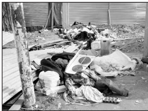
Неужели в нашей стране так всё плохо, что нет возможности достроить детский сад?

Но больше всего нас беспокоят огромные кучи самых разнообразных отходов, гниющих на этой заброшенной стройке. Уже не раз мы видели здесь откормленных (наверное, на убой) крыс. Забегают они и на газоны наших домов. А, ведь, здесь гуляют дети, и не известно, какую заразу они могут "подцепить" от этих быстро плодящихся животных.