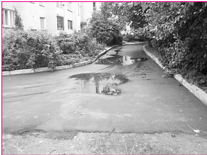
Это не дорога - это халтура