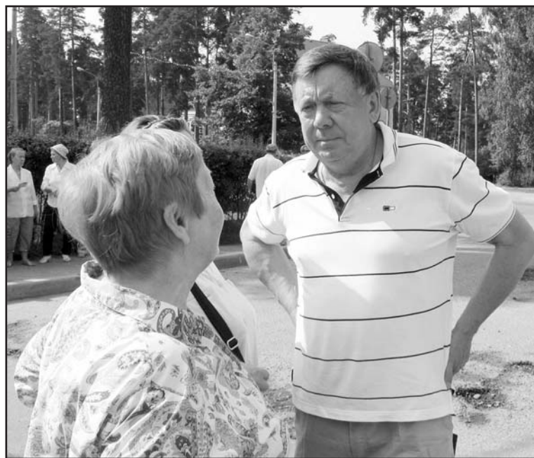
На митинг пришел депутат Госдумы РФ, председатель садоводов России В.И. Захарьящев

ций коммунального комплекса, оказываемых ОАО "Всеволожские тепловые сети", в результате которого тариф на холодную воду для юридических лиц увеличен на 60 процентов;