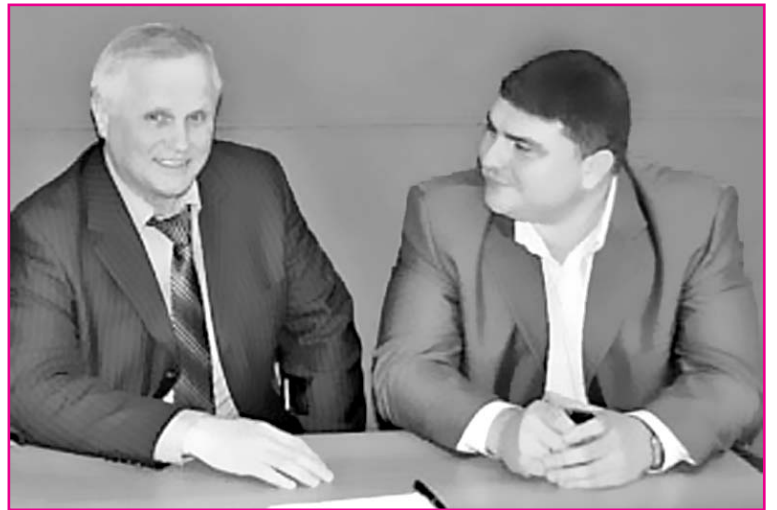
"Ум, Честь и Совесть..." КПРФ