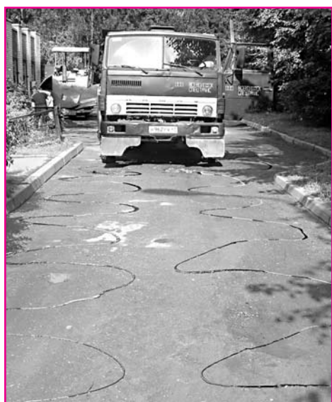
На старый асфальт скоро положат новый