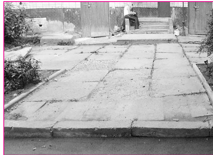
Этот подъезд должен быть выложен брусчаткой

дорог, новый вид деятельности - капитальный ремонт придомовых территорий. Лучше бы он этого не делал. Освоив придомовые территории в микрорайоне Бернгардовка, "Спецтранс" перешел в микрорайон Котово поле. Скоро и отсюда посыпятся жалобы и депутатские запросы.