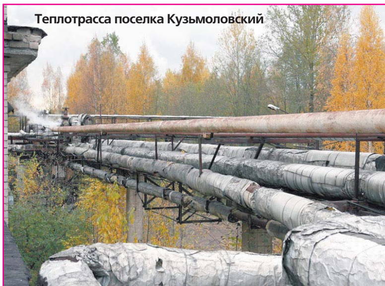
Теплотрасса поселка Кузьмолковский