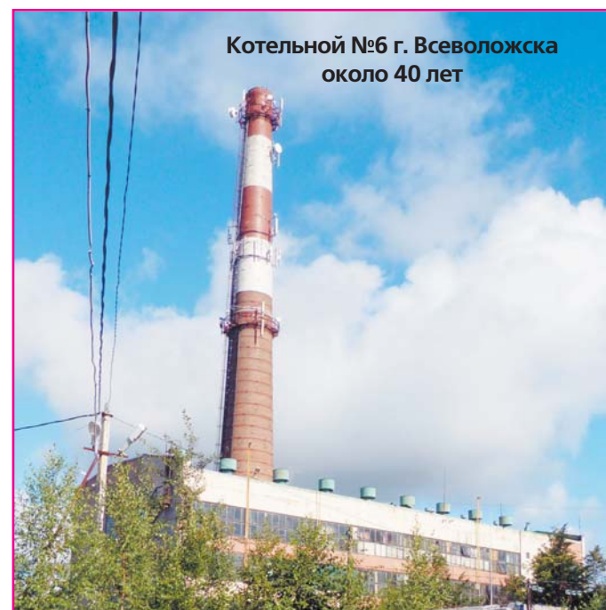
Котельной №6 г. Всеволожска около 40 лет