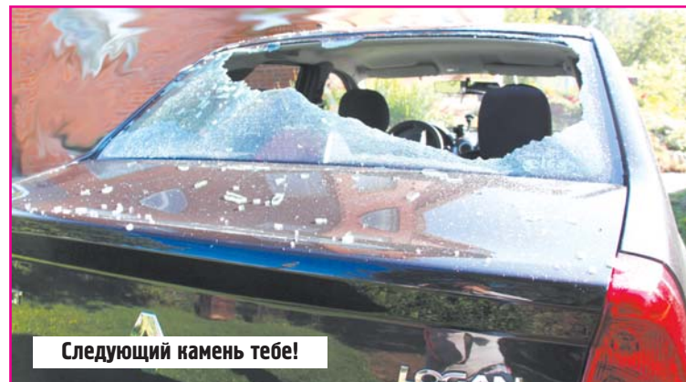
Следующий камень тебе!

Убийство челяди - не преступление", гласила "Русская правда". Россия вернулась в XI век? Жизнь простолюдина не стоит и ломаного гроша. А что позволено России криминальной, не позволено России остальной!