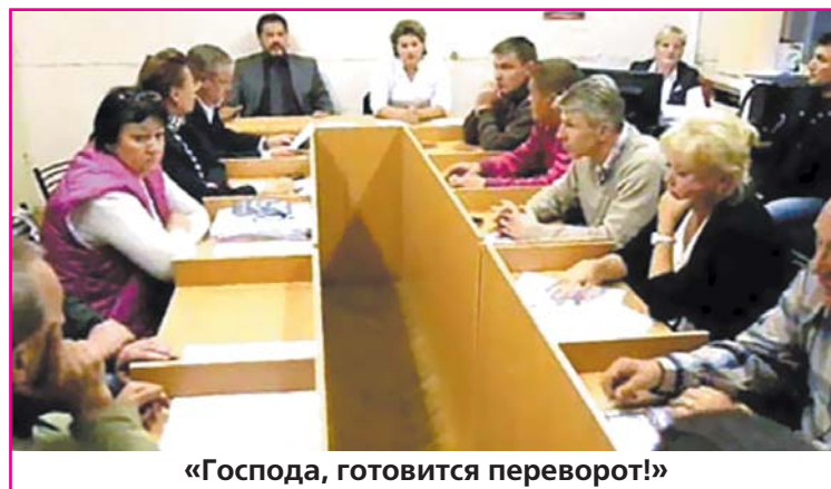
«Господа, готовится переворот!»