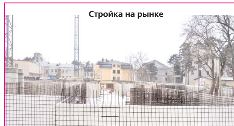
Стройка на рынке