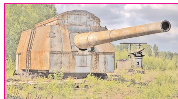
Главный калибр Военно-морского Флота в годы Великой Отечественной войны скоро продадут на металлолом