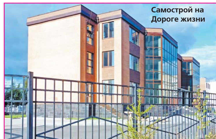
Самострой на Дороге жизни