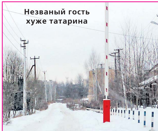
Незваный гость хуже татарина