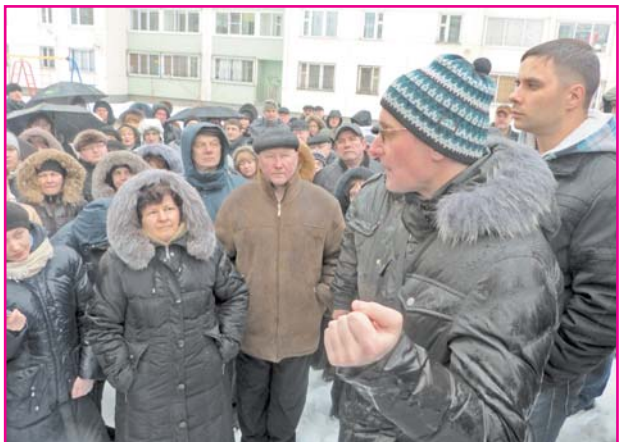
Сход на ул. Невская

Вынести вопрос о плате за содержание жилья на собрания жителей руководство компании не посчитало нужным.