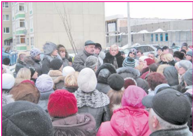
Сход на ул. Добровольского

"УК "ВКС" неправомерно установило для собственников жилья плату за содержание и ремонт жилого помещения с учетом решения Совета депутатов города Всеволожска, которое касается только нанимателей жилья по договорам социального найма.