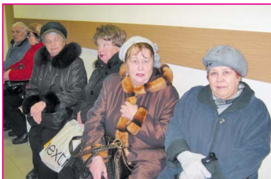
Всеволожские ветераны пришли поддержать потерпевших от властного произвола