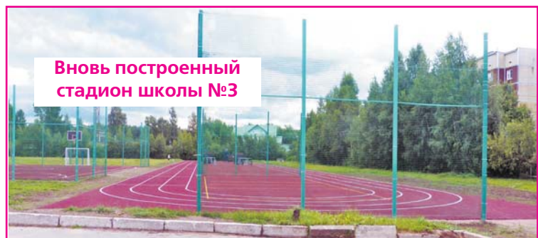
Вновь построенный стадион школы №3

Много нареканий жителей вызывает медицинское обслуживание. В микрорайоне Южный, к примеру, семья военнослужащих запаса обслуживаются в подведомственной Министерству Обороны поликлинике. А