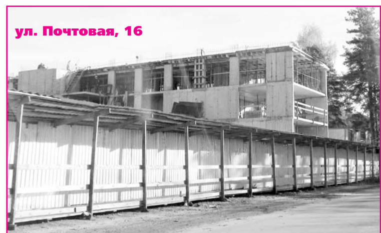
ул. Почтовая, 16