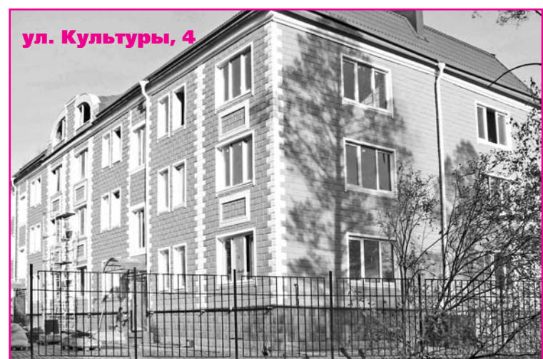
ул. Культуры, 4

Ветеранская ПРАВДА, №19 от 15 октября 2013 г.