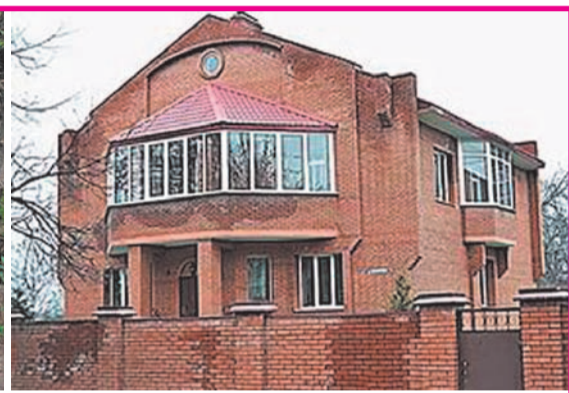
Особняк избушке не товарищ!