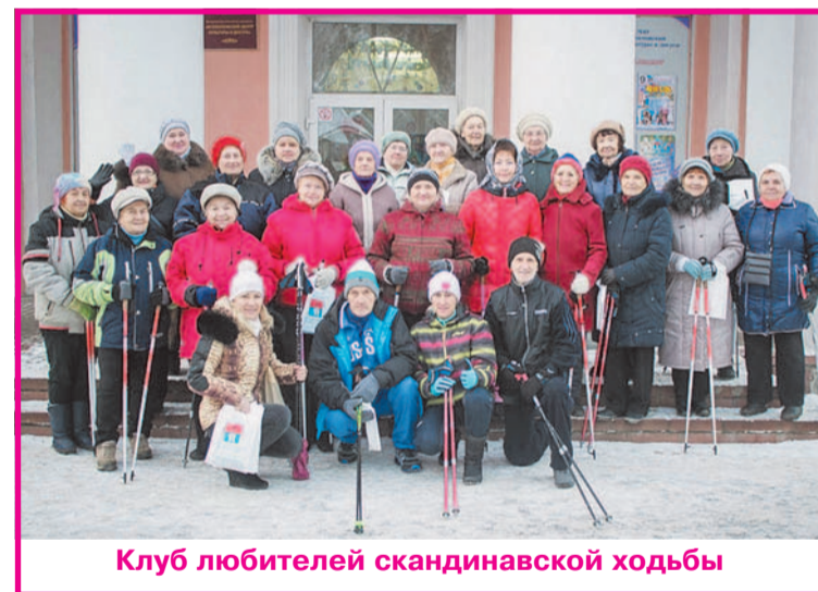
Клуб любителей скандинавской ходьбы

смотрел и принял проект налогообложения земельных участков, на которых расположены общеобразовательные и дошкольные учреждения, и которые находятся на балансе администрации Всеволожского района. Это все равно, что переложить из одного кармана в другой одни и те же деньги. Школы и детские сады воспитывают наших же детей. Лучше, вместо этого налога, договориться с районной администрацией о размещении подростковых клубов в поме-