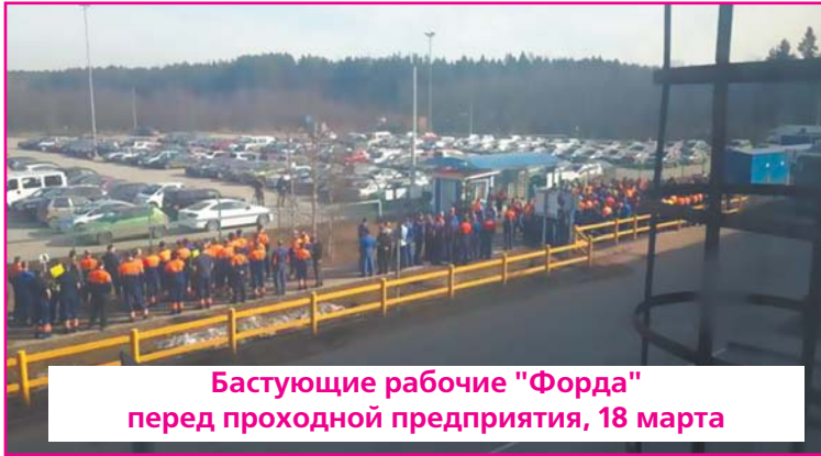
Бастующие рабочие "Форда" перед проходной предприятия, 18 марта

Забастовка на всеволжском "Форде" продолжается. В ней принимает участие 35 % от общего числа работников цеха сборки и 40% сотрудников кузовного цеха. В соответствии с планом забастовки, другие подразделения не задействованы в коллективных действиях. С каждым днем давление на работодателя усиливается путем ввода в забастовку новых работников.