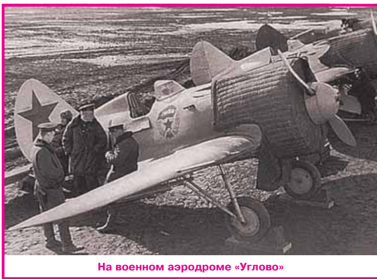
На военном аэродроме «Углово»