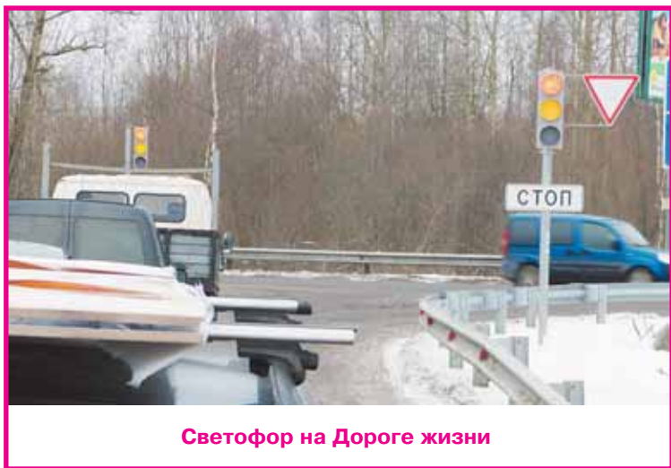
Светофор на Дороге жизни

дующее трудоустройство во Всеволожске, Приозерске, Выборге, Тихвине, Волосово. С открытием этого мультицентра ежегодно 300 молодых инвалидов получат профессию на всю жизнь.