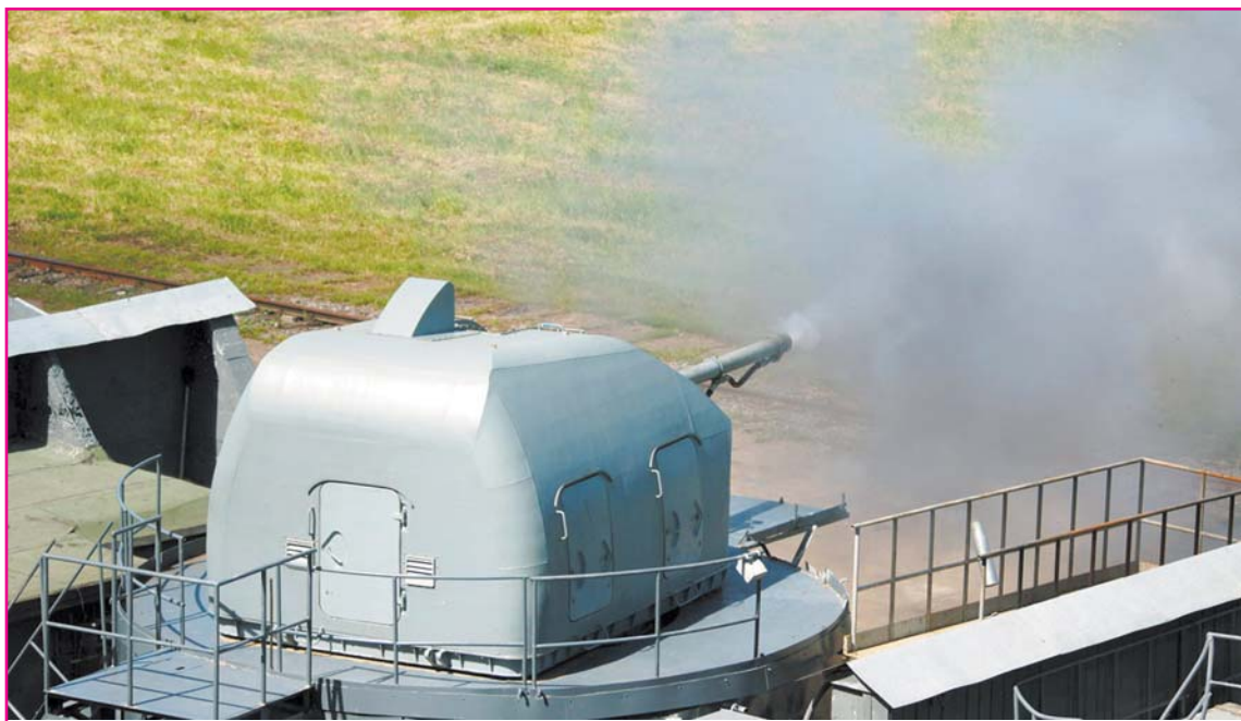
Какое НАТО? От своих расхитителей не отбиться!

Возможно, сегодня Министерству обороны не нужно гигантское наследство СССР. Но на фоне расхищения обычного лесного фонда оборонных лесов оставались природным резервом. Сейчас рассматривается вопрос о передаче оборонных лесов муниципалитетам. Это означает, что тысячи га будут (уже законно) распро-