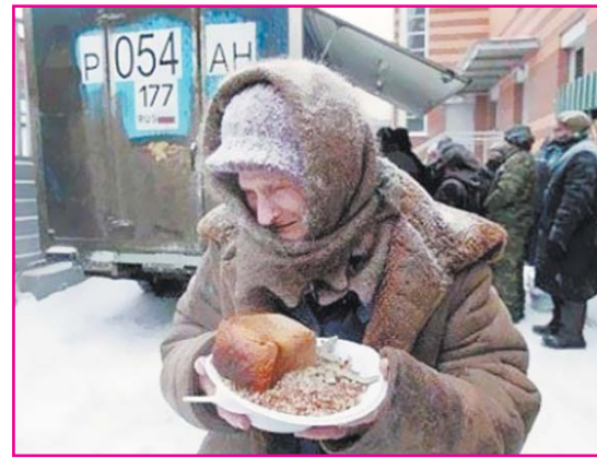
Но не было этого

ниц! Это был наш город! Весь! Целиком! С ржавыми "Москвичами" и "Запорожцами" во дворах, с чахлыми сквериками и кустиками вдоль каналов и рек. С гремящими и скрипящими трамваями.