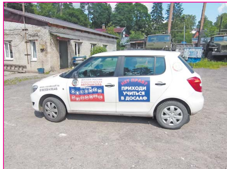
Парадокс. Техника есть, а обучать некого