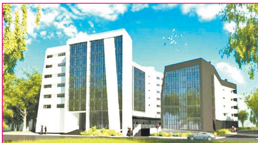
Это - реклама

сети, разбитые многотонным транспортом, в том числе и строителями этих многоэтажных домов, улицы Почтовая и Советская.