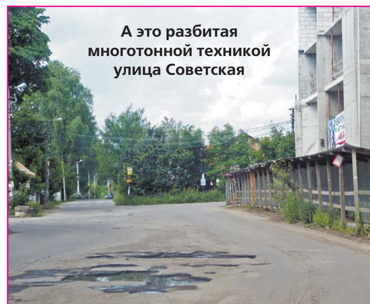
А это разбитая многотонной техникой улица Советская

Проезжал недавно по улице Приютинская, увидел рекламный щит с красивыми лебедями и слоганом: Пора вить гнездо!