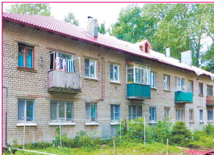
Ул. Дружбы, д.4

И вот он пришел. Кое-где. Согласно краткосрочной программе капитального ремонта в 2015 году во Всеволожске произво-