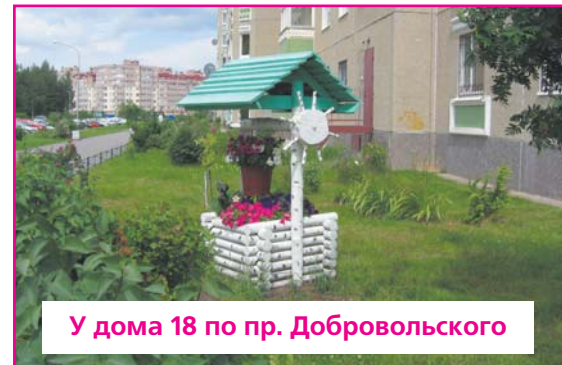
У дома 18 по пр. Добровольского