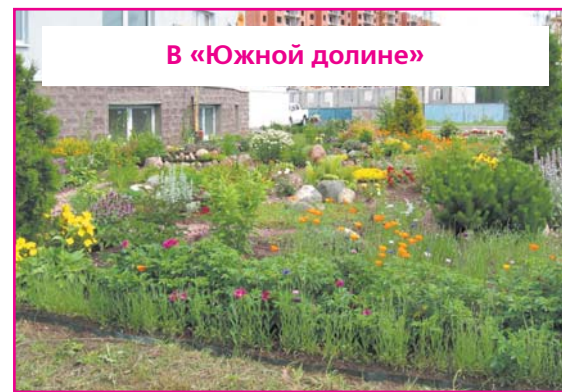
В «Южной долине»

"Южная долина" ещё заселяется, но я не сомневаюсь, что лет через пятнадцать здесь будет самый красивый парк Южного жилого района.