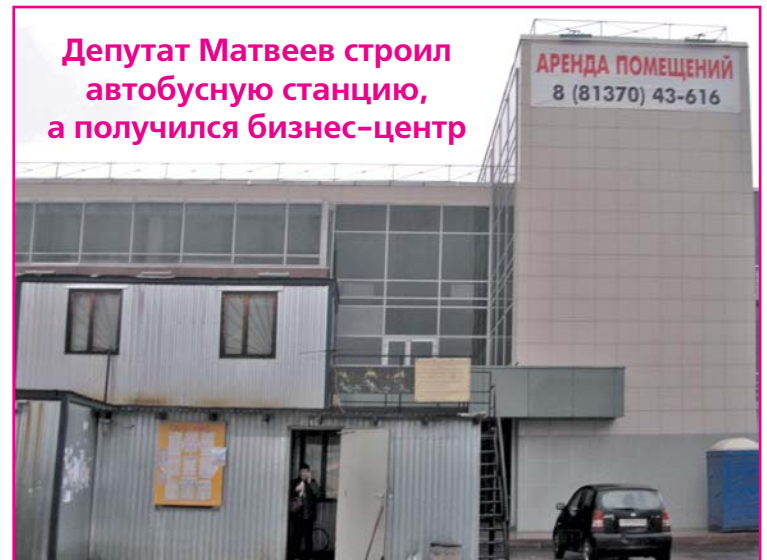
Депутат Матвеев строил автобусную станцию, а получился бизнес-центр

Депутат Матвеев, например, на Всеволожском проспекте уже построил, а на стыке деревни Кальтино и микрорайона Южный строит на землях ИЖС дворцы, которые не имеют ничего общего с индивидуальным жильем. Администрация Всеволожска в судах двух инстанций доказывала, что депутат-бизнесмен нарушает Градостроительный кодекс. Суды отменили все доводы администрации. И я буду вынужден дать этому коммерсанту разрешение на строительство, и подпишу акт