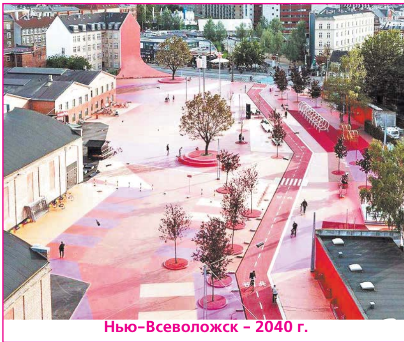
Нью-Всеволожск - 2040 г.

Давеча столкнулось два мнения на Прищелговский массив. Страсти кипели шекспиров-