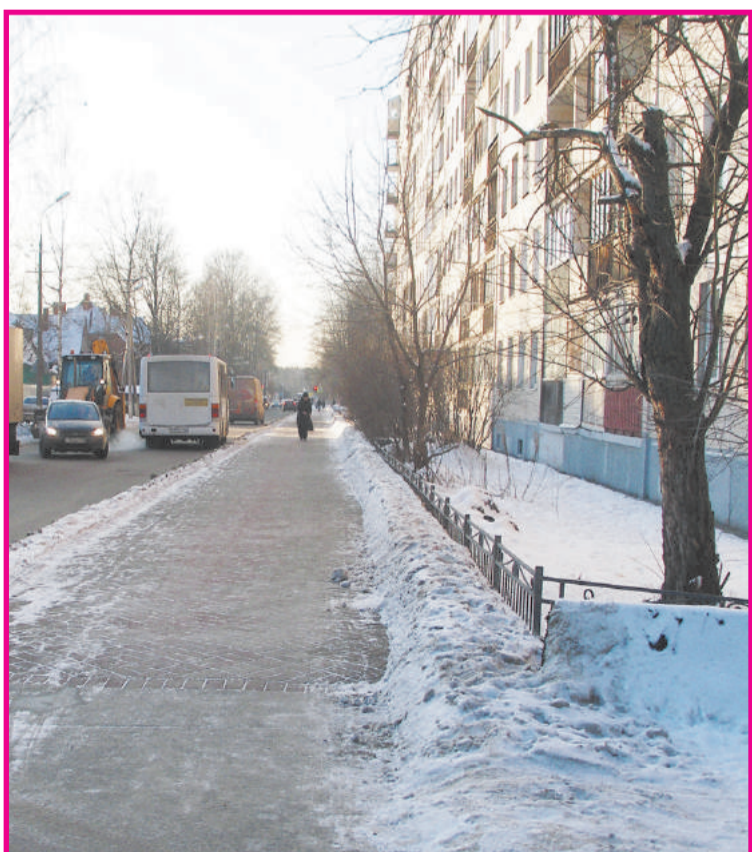
Не будет принят бюджет, не на что будет убирать даже улицы и тротуары